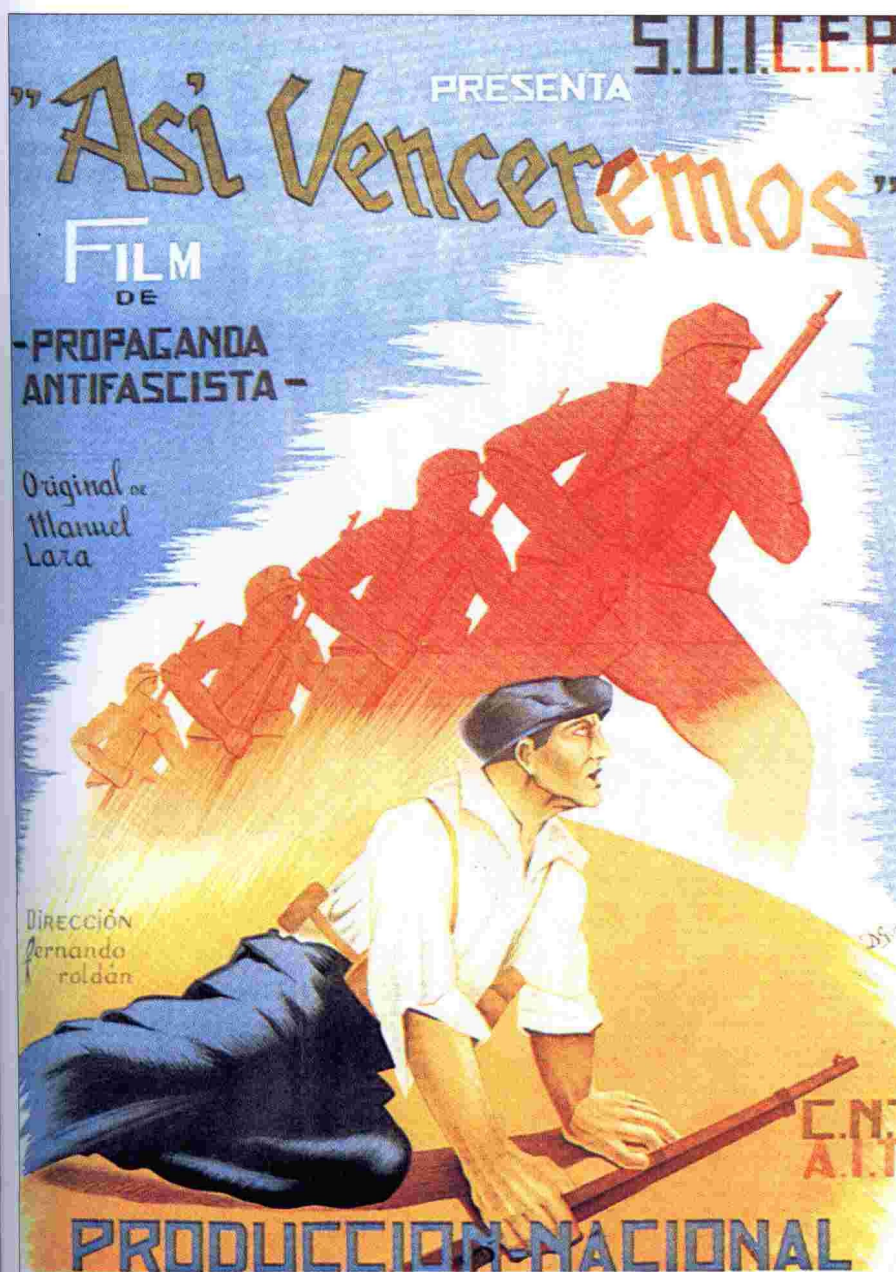
Affiche dessinée par D. Gomez pour le S.U.I.C.E.P. et annonçant le film de Fernando Roldán «Así venceremos».

Source : DUPONT Cédric Ils ont osé ! , Toulouse, Los Solidarios, 2002